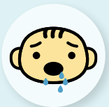
Écoulement de bave